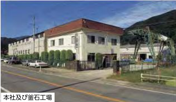
本社及び釜石工場