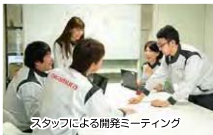
スタッフによる開発ミーティング