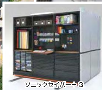
ソニックセイバー+G