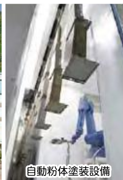
自動粉体塗装設備