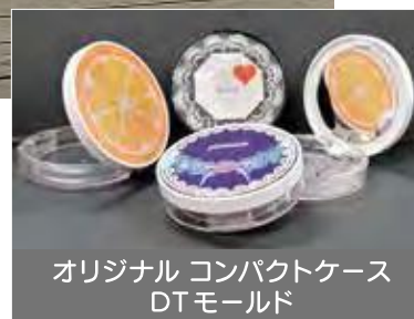
オリジナル コンパクトケース DTモールド

国内大手化粧品メーカー向けプラスチック容器の開発、製造販売 パルプモールド製品の開発、製造販売 その他プラスチック製品の製造販売